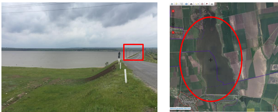
Figura 1. Amplasarea lacului de acumulare Taraclia.

În urma constatărilor vizuale de către beneficiar s-a pus problema întreprinderii de măsuri urgente și profesionale. Astfel s-au stabilit mai multe acțiuni printre care efectuarea măsurătorilor topo-geodezice în câteva perioade (ciclice) în scopul evaluării evoluției distrugerii dalelor din beton armat și a eroziunii taluzului din pământ. Rezultatele cercetărilor vor fi prezentate persoanelor cu factor de decizie în vederea întreprinderii măsurilor necesare.