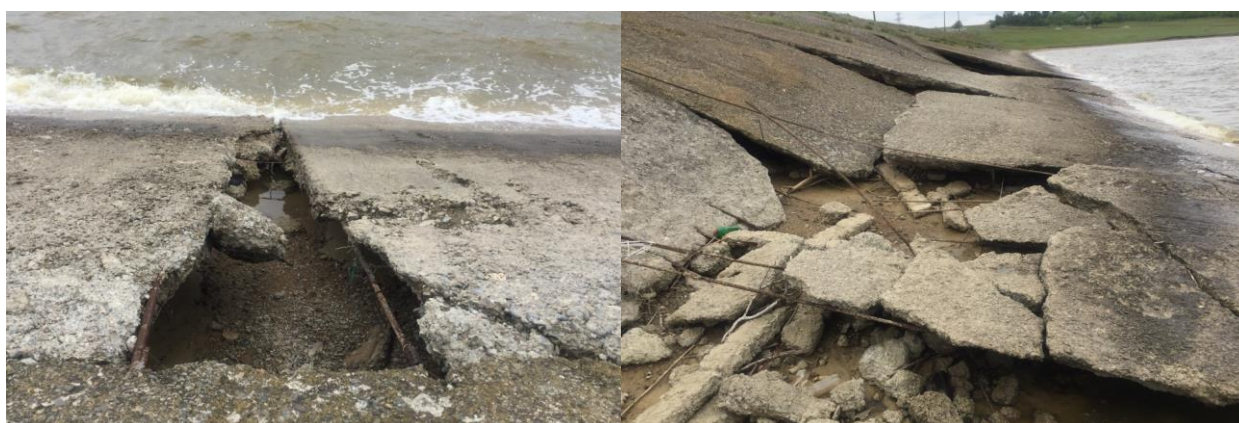
Figura 2. Modul de afectare a dalelor din beton armat.

În urma constatărilor vizuale de către beneficiar s-a pus problema întreprinderii de măsuri urgente și profesionale. Astfel s-au stabilit mai multe acțiuni printre care efectuarea măsurătorilor topo-geodezice în câteva perioade (ciclice) în scopul evaluării evoluției distrugerii dalelor din beton armat și a eroziunii taluzului din pământ. Rezultatele cercetărilor vor fi prezentate persoanelor cu factor de decizie în vederea întreprinderii măsurilor necesare.