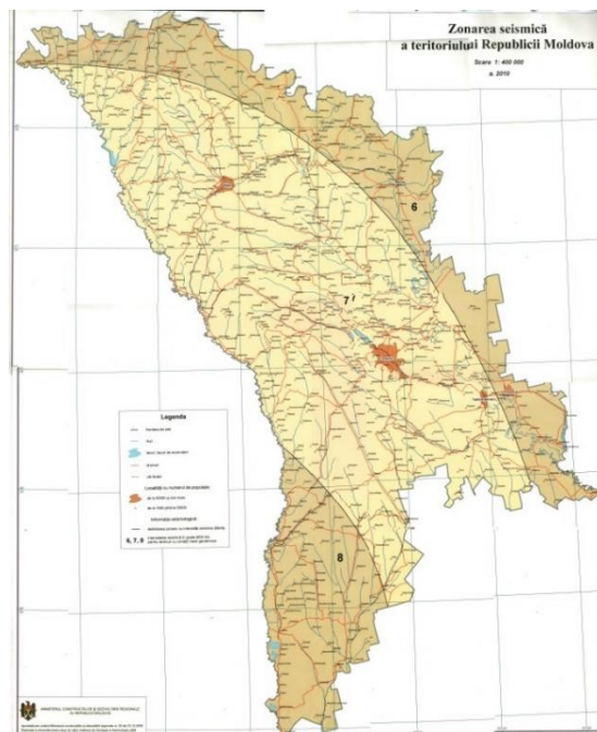
Рис. 1. Настенная карта сейсмического зонирования Р. Молдова

Карта сейсмического зонирования Молдовы выполнена картографическим методом ареалов [1] разных оттенков, охватывающих северо-восточную, центральную и южную регионы Республики Молдова. На рис. 1 представлена настенная карта сейсмического зонирования Р. Молдова, на которой картографическая основа включает в себя подробную гидрографическую сеть, дорожную сеть и пуансоны населенных пунктов.