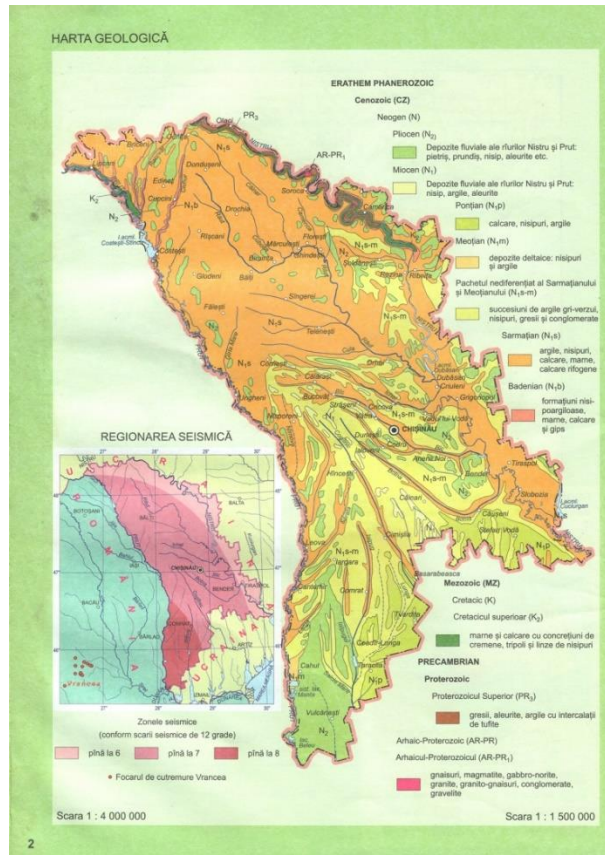
Рис. 2. Карта-врезка сейсмического зонирования Р. Молдова

Для бумажного школьного атласа стало возможным вместить эту карту в масштабе 1 : 4 000 000 в качестве карты-врезки для Геологической карты (Рис. 2). Из картографической основы на этой карте остались только столица, 4 крупнейших города и несколько рек. Чем выше интенсивность землетрясений по 12-балльная шкала Медведова — Шпонхойера — Карника (MSK-64) выявлена на обозначенной территории, тем ярче оттенок красного цвета.