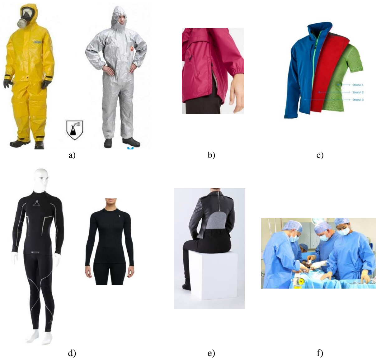
Figura 1. Îmbrăcămintea funcțională:

Domeniul îmbrăcămintei funcționale este relativ nou pentru domeniul industriei textile, în același timp însă prezintă un interes sporit datorită exigențelor impuse de purtători (figura 1).