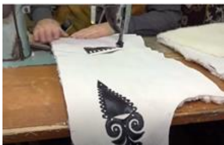
Figura 7. Coaserea buzunarului aplicat inferior și superior [3]