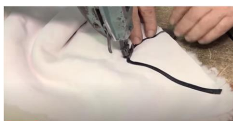
Figura 6. Coaserea elementului tradițional pe părțile laterală [3]