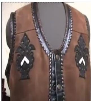
Figura 13. Bondiță pentru bărbați [2]