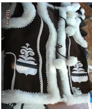
Figura 9. Bondiță pentru femei [3]

Bondița reprezintă o piesă vestementară din piei de ovine, ”tip vestă”, cu sprijin pe umeri, fără mânici, purtată peste cămașă. Vestele din piele de oaie poartă denumirea de ”bondă, bondiță și peptar”. După tipul construcției pot fi: cu deschiderea pe mijloc și fixare cu nasturi, cu deschiderea deplasată lateral, cu terminație scurtă și fără fixarea deschiderii. Preponderent, este răspândit primul tip de construcție. Dezvoltarea cojocăritului și confecționarea bondiței a continuat și ”în a doua jumătate a secolului al XIX-lea și în secolul XX-lea, în fiecare regiune activau meșteri cojocari, în zona de sud al Moldovei– raionul Cahul, Vulcănești, Ștefan-Vodă, unde până în prezent activează cojocari renumiți care confecționează cojoace și bondițe”, 1 ” Din raionul Cahul, satul Colibaș îi aflăm pe meșterii populari (Constantin Cojan și Elena Cojan), Fig. 10, tot din raionul Cahul, satul Slobozia Mare, desfășoară activitatea ca meșter popular Dumitru Zaporojan, Fig. 12. Specific zonei date ca materia primă se folosesc piei și blănuri de ovine (mici/cârlani) tip „Țigaie” de culoare albă și cu spicul/blana moale sau poate fi colorată în cafeniu sau negeu Fig. 9 și Fig. 11. Bondița de la sud este ornamentată ”cu motive pastorale” 1 specific zonei și este croită dreaptă, cu sistem de închidere pînă sus la bărbați și la femei cu răscoiala gîtului în formă de unghi [2, 4].