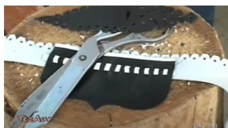
Figura 4. Dantelarea fâșiei și perforarea buzunarului inferior [3]