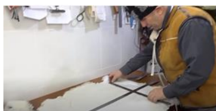
Figura 2. Proiectarea și croirea bondiței din piele de ovine [3]