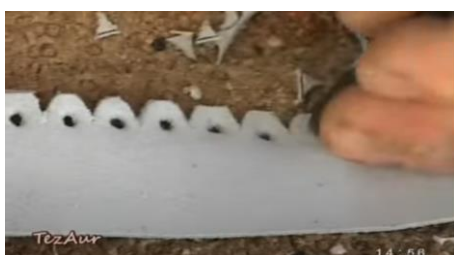
Figura 3. Dantelarea și perforarea marginii fâșiei decorative [3]