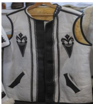
Figura 11. Bondiță pentru bărbați [2]