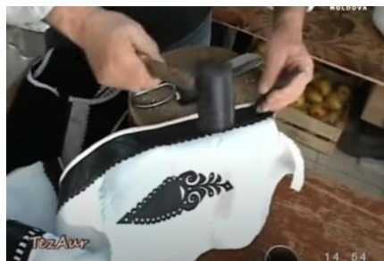
Figura 8. Efectuarea cheutorilor [3]