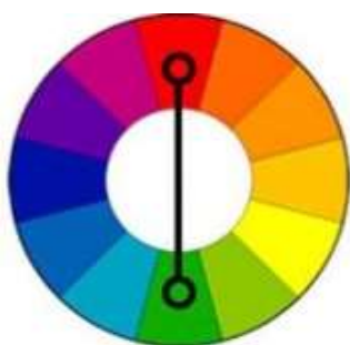
Fig. 3b. Cul. complementare