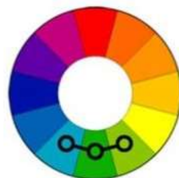
Fig. 3a Culori analog

Un aport considerabil la confirmarea că designul și arhitectura de interior prin cromatica și caracterul stilistic, conceptual influențează enorm persoanele care se află un anumit timp în acest mediu îl are cercetările din domeniul organizării cromatice ale spațiului interior fiind semnate de Buimistru T, Constantin P. etc. [6]