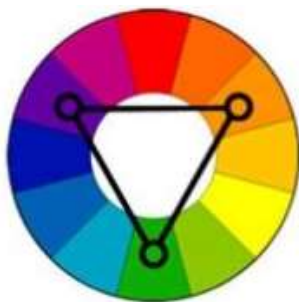
Fig. 3c Triadele de cul.