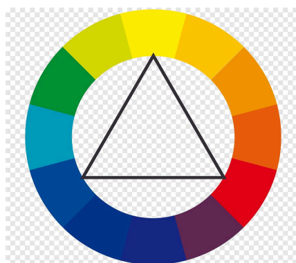
Fig. 2 Sistemul triunghi