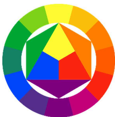
Fig. 1 Cercul cromatic