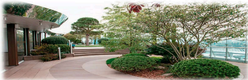
Figura 1. Amenajarea unui acoperiș verde (green roof)

clădiri cu acoperiș verde. Îndeplinirea recomandărilor Codurilor Practice elaborate în Republica Moldova va face posibilă utilizarea mai completă a avantajelor acoperișurilor verzi în construcții. De asemenea, în Federația Rusă a fost pus în vigoare GOST R58875-2020 "Amenajarea și întreținerea acoperișuri verzi ale clădirilor și construcțiilor. Cerințe tehnice și de mediu". Acest standard, pentru prima dată, stabilește caracteristicile tipologice ale acoperișurilor verzi.