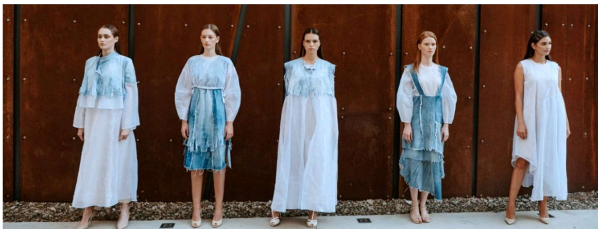
Figura 3. Colecția elaborată în cadrul proiectului de licență [9]

Colecția elaborată este determinată de contrastul suprafețelor opace – denimul cu cele transparente – combinarea-organza cu tricot. Suprapunerea acestora ne conferă o imagine optică compusă (prin organza se prevede denimul), Fig.3.