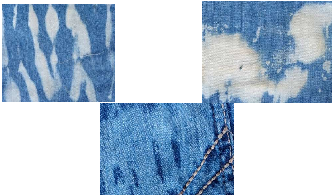
Figura 1. Decolorarea denimului în urma dezinfectării

Spălarea și dezinfectarea denimului – o fază importantă, în condițiile colectării blugilor la mână a doua. S-a propus folosirea soluției de clor pentru spălarea și dezinfectarea produselor. La folosirea clorului, au fost obținute efecte vizuale inedite, devenind parte cu importanță majoră al aspectului estetic și unic în colecția descrisă, Fig. 1.