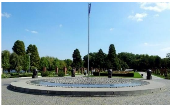
Figura 4. Monumentul Părinților Fondatori ai Uniunii Europene [4]

Un monument, similar dedicat părinților fondatori ai Uniunii Europene, a fost dezvelit în cadrul unei ceremonii oficiale, în orașul francez Metz.