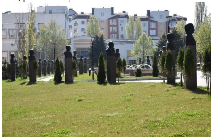
Figura 3. Aleea savanților și medicilor iluștri din Chișinău [3]

Actualmente, pentru că suprafața actuală nu permite o extindere a Aleii, se caută posibilități de a amplasa alte câteva busturi în spații aferente instituțiilor în cadrul cărora au activat personalitățile înaintate, sau la locul de trai, pentru înveșnicirea numelor.