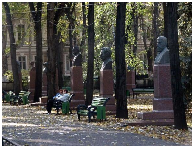
Figura 1. Aleea Clasicilor din municipiul Chișinău [1]

Odată cu ratificarea Convențiilor, Republica Moldova beneficiază de dreptul de a propune bunuri/situri de patrimoniu cultural și natural pentru înscriere în Lista Patrimoniului Mondial UNESCO și, respectiv, de a propune bunuri de patrimoniu cultural imaterial pentru înscriere în Lista reprezentativă UNESCO a patrimoniului cultural imaterial al umanității.