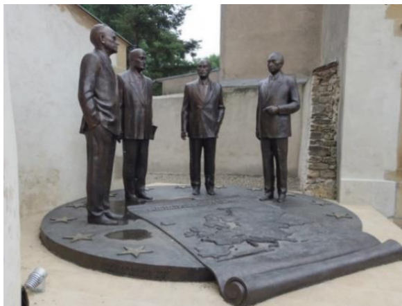
Figura 5. Monumentul dedicat părinților fondatori ai Uniunii Europene în orașul Metz din Franța [5]

Autorul monumentului este arhitectul rus de origine georgiană Zurab Tsereteli, președintele Academiei de Arte a Rusiei. Ansamblul sculptural reprezintă patru politicieni, care au jucat un rol semnificativ în crearea Uniunii Europene. Aceștia sunt francezii Robert Schuman și Jean Monnet, germanul Konrad Adenauer și italianul Alcide de Gasperi - oameni de stat care au trăit în secolul trecut și au aspirat la unificarea Europei, fiind considerați părinții fondatori ai UE.