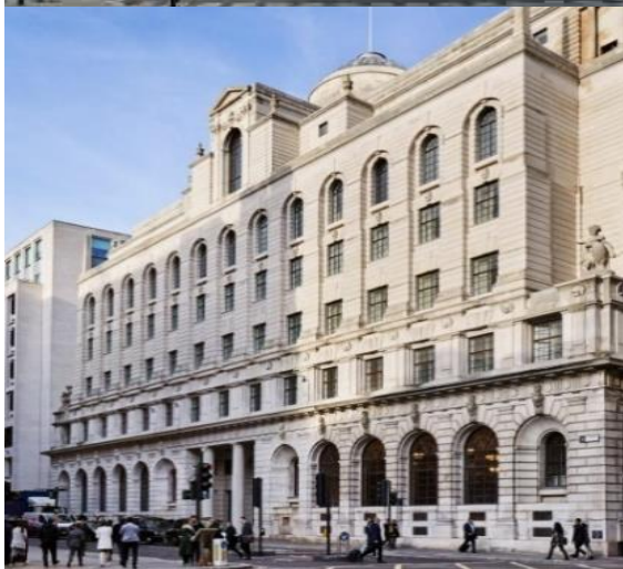
Denumirea: Centru multifuncțional (hotel, restaurant, bar. Sala de ședințe)