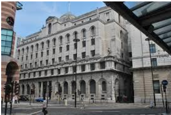
Denumirea: sediu central Midland Bank Amplasarea: London Anul construcției: 1929