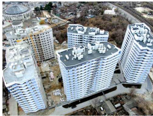
Рис. 6. Жилой комплекс вид с верху г. Кишинев

Во многих европейских странах нормирование инсоляции территорий – прерогатива государственного уровня.