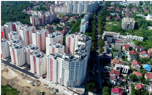
Рис. 1. Современная застройка г. Кишинева

недостает витамина D, то кальций из пищи не усваивается, и потребность в нем восполняется за счет кальция костей, таким образом, развиваются многие болезни, в том числе рахит.