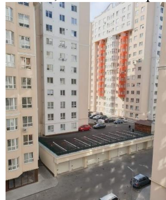
Рис.2. г. Кишинева (сплошная затененность наблюдается отсутствие инсоляции)

Инсоляция городского пространства, необходимая составляющая жизни каждого человека; Вопрос о том, какое количество солнечного света необходимо человеку, до сих пор остается дискуссионным, поскольку каждый человек имеет разные потребности в получаемой световой энергии. Однако с уверенностью можно сказать, что ультрафиолет необходим для каждого человека, жизнь без ультрафиолета как части света невозможна. Солнечный свет необходим живым организмам, ибо является источником витамина D3. Если в организме недостает витамина D, то кальций из пищи не усваивается, и потребность в нем восполняется за счет кальция костей, таким образом, развиваются многие болезни, в том числе рахит.