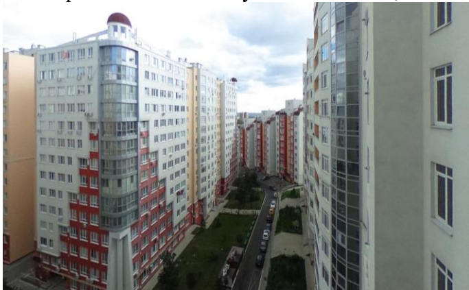
Рис. 3. г. Кишинева (затененность отсутствие социальной инфраструктуры и зеленых насаждений.)

Кроме того, Солнце помогает человеку справиться с простудными заболеваниями, поскольку поддерживает иммунную систему организма, и т. д. Кишинева уже много лет живет без полноценного и современного генерального градостроительного плана. До 2007 года власти ориентировались на генплан 1998 года, а в 2008 приняли новый, который, по мнению специалистов, оказался непроработанным с учетом современных потребностей общества, а также в нем не было зонального плана исторической части города. В 2015 году решили реанимировать данный документ 2008 года, но из этого так ничего и не вышло.