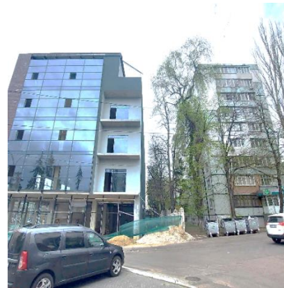
Рис. 4. Проспект Дачия - несоблюдение расстояния между зданиями