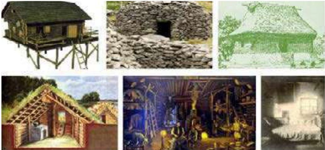
Figura 1. Concept de arhitectura tradițională rustică la diferite popoare

Arhitectura tradițională rustică, indiferent de țară și zona geografică, presupune folosirea materialelor naturale din mediul înconjurător din care se construiesc locuințele – bârne de lemn, piatră, lut, paie atât la interior cât și exterior, bunăoară la popoarele din zona României, Republicii Moldova, Ucrainei s-a folosit lemnul în zonele împădurite și piatra în zonele de munte (fig. 1) (Marcu-Lapadat 2013).