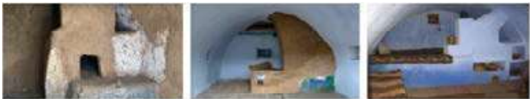
Figura 4. Tipologia constructivă a sobei din locuința – bordei