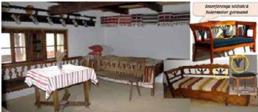
Figura 8. Camera de zi, locuință tradițională cu interferență stilistică biedermeier

Modestia locuinței țărănești reprezintă țesăturile din cânepă, lână, in, lucrate de gospodina casei în zilele de iarnă-lăicere, păretare, prosoape și vestimentația familiei. Dar totuși mobilierul moldovenesc posedă influența stilisticii biedermeier cu linii fine curbate sau drepte, spre exemplu lavița-lada-canapea pentru podoabe are tetieră și cotiere ușor ondulate completate cu elemente de trifoi stilizat, caracteristic stilisticii germane. Obiectele de mobilier din casă devin mai variate: lavița și cufărul-comoda, blidarele și colțarele incrustate sau pictate cu motive vegetative, geometrice, pe poziționează tacâmurii din ceramică sau lemn (fig. 8) (Munteanu A. 2018, 37 p.; Munteanu A. 2018, 32 p.).