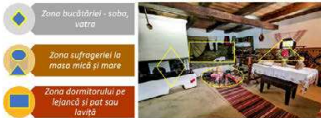
Figura 6. Casa memorială „Ion Creangă” din Humulești, județul Neamț, zona spațiului interior

Un alt exemplu a sălașului tradițional al țăranilor este casă bordei din satul Cornova, fostul ținut al județului Orhei (azi, r-nul Ungheni) Basarabia, 1931 (fig. 5), este descrierea unui grup de cercetători români în teritoriu, sat care suferise influență politică și culturală, dar și administrativă rusească, prin împărțirea populației între ”dvoreni” – boieri, mijlocii și săracii – țăranii în ”christiani, mesceanini, grajdanini” (Gusti D., Diaconu M., Rostaș Z., Șoimaru V. 2011; Защук А. 1868 ). Casa bordei – locuința modestă și umilă cu un interior de nivel jos și întunecat, zidită și lipită cu lut și paie, văruiță, prezintă un plan cu 1-2 odăi, camera de zi și adăpostul pentru animale. Situată către răsărit, fațada cu două geamuri mici și unul în spate către asfințit acoperită cu paie, spălată de ploaie din temelie. Însă sunt fragmente de descriere a comunității cu port popular, a caselor ”dvorenilor” – boierilor cu arhitectură tradițională de admirat. Interioarele bogat amenajate cu cearșafuri albe de pânză, cu fețe de pernă albe cu dantele, tacâmuri din ceramică, cu fotografii pe pereți, dar și frumoasele scoarțe moldovenești (Nesterov T. 2003, 213).