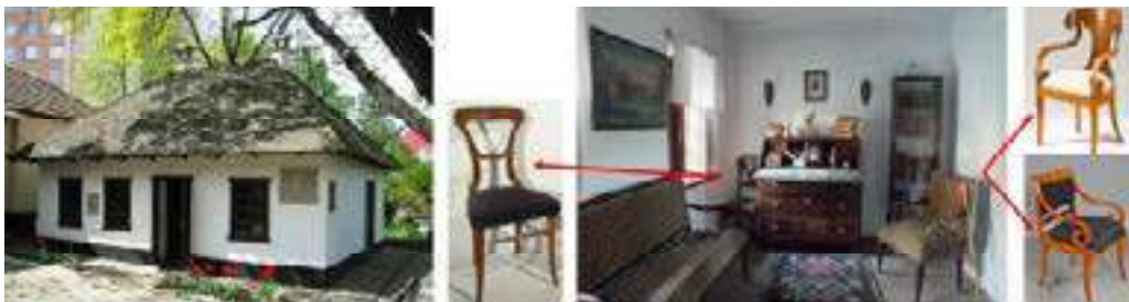
Figura 9. Casa-muzeu Alexandr Pușkin, Chișinău, spațiu interior, interferență stilistică biedermeier, austriacă

Modestia locuinței țărănești reprezintă țesăturile din cânepă, lână, in, lucrate de gospodina casei în zilele de iarnă-lăicere, păretare, prosoape și vestimentația familiei. Dar totuși mobilierul moldovenesc posedă influența stilisticii biedermeier cu linii fine curbate sau drepte, spre exemplu lavița-lada-canapea pentru podoabe are tetieră și cotiere ușor ondulate completate cu elemente de trifoi stilizat, caracteristic stilisticii germane. Obiectele de mobilier din casă devin mai variate: lavița și cufărul-comoda, blidarele și colțarele incrustate sau pictate cu motive vegetative, geometrice, pe poziționează tacâmurii din ceramică sau lemn (fig. 8) (Munteanu A. 2018, 37 p.; Munteanu A. 2018, 32 p.).