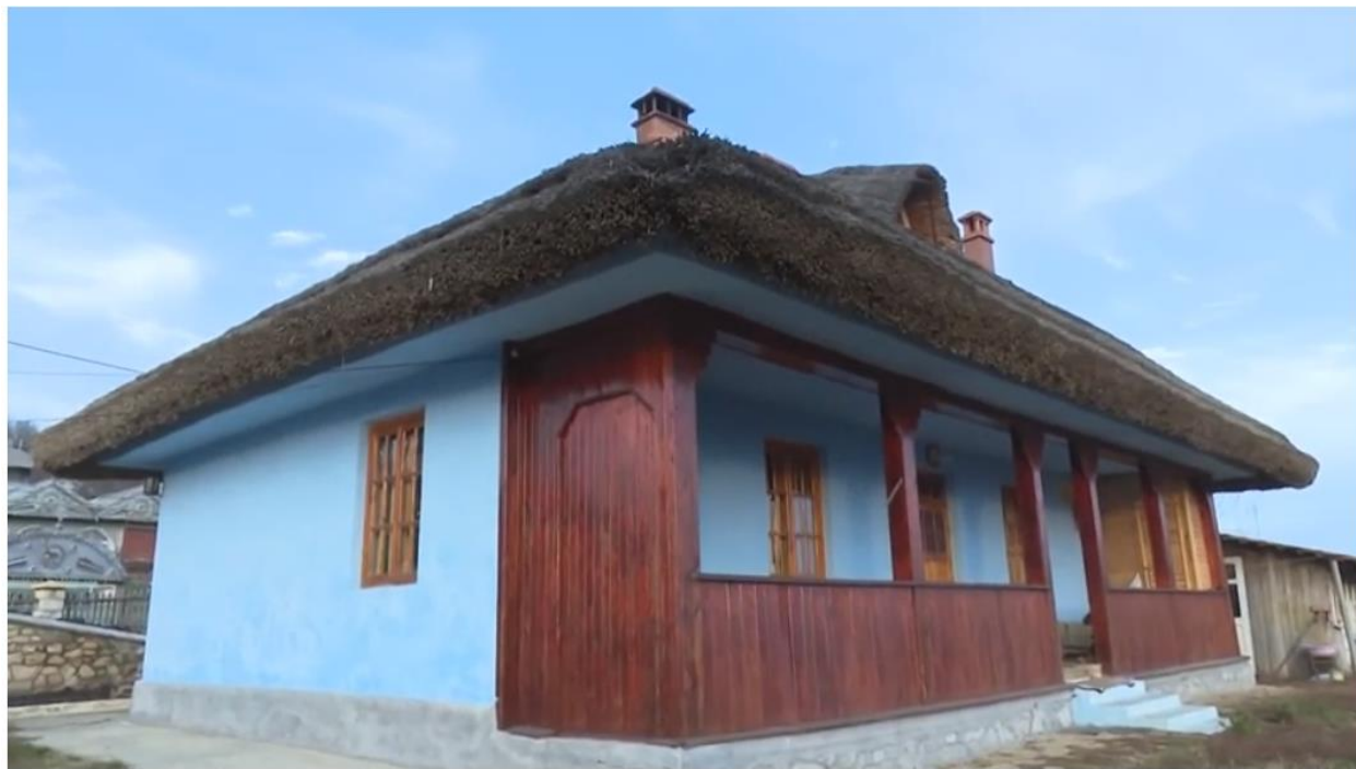
Figura 1. Casă din lut modernă în Moldova

adesea la instalarea sistemelor de ventilație și izolație. Studiile arată că ferestrele din PVC și aerul condiționat afectează organismele, iar aerul dintr-o construcție de locuințe poate să fie mai poluat decât în exterior. Vaporii care emană permanent din vopseaua de pe pereți, din lacul de podea sau din mobilierul modern din PAL și PFL care produc gaze nocive, susținute între geamuri și în cele din urmă afectează organele umane, cum ar fi plămânul sau pielea și căile respiratorii. Aerul condiționat, praful reciclat prin conducte și microorganismele pot provoca alergii severe, în special la persoanele sensibile.