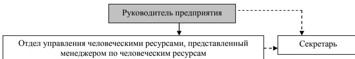
Рис.2. Организационная структура отдела управления человеческими ресурсами предприятия

а) для малых и микропредприятий (рисунок 2);