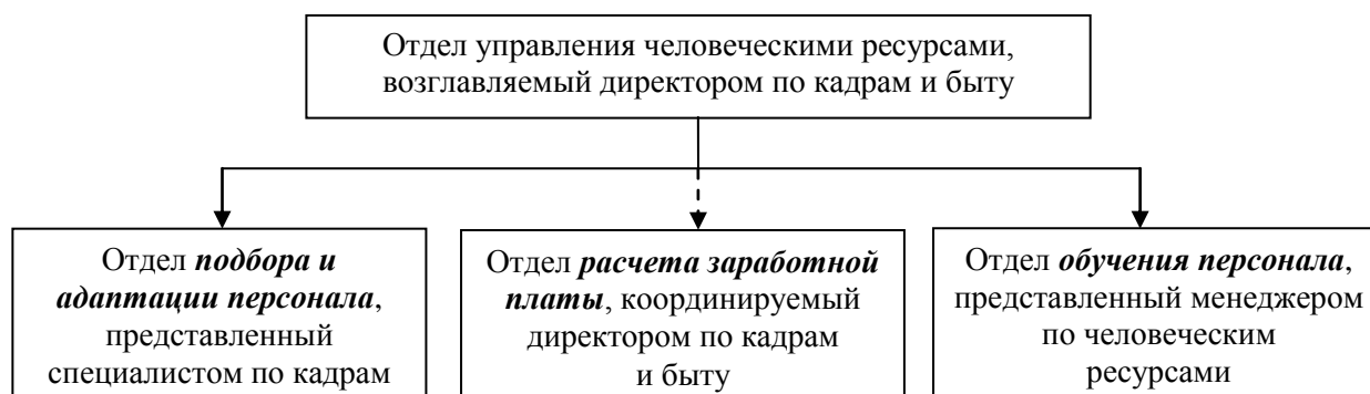
Рис.4. Организационная структура отдела управления человеческими ресурсами предприятия.