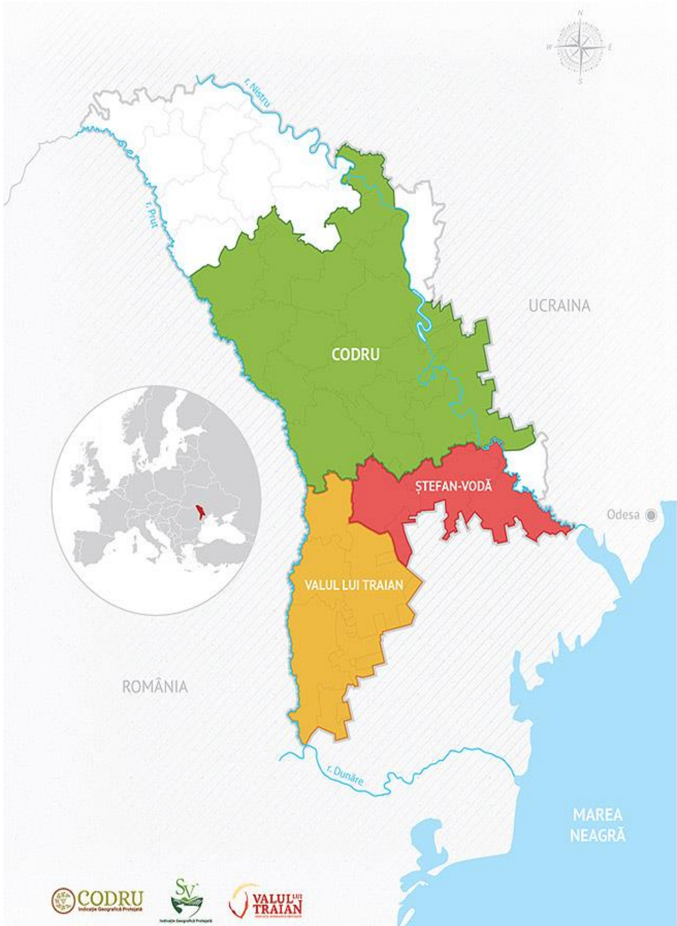
Figura 2. Harta Regiunilor cu Indicație Geografică Protejată din Republica Moldova.