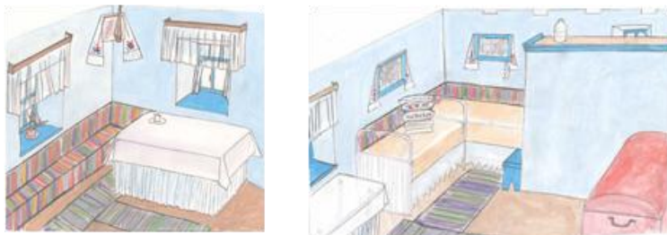
Рис. 3. Интерьер дома, молдавское село, Молдова, Левобережье (1940-1970 гг.)

Архаичные орнаменты на кувшинах периода Кукутень сохранили элементы различных стилизованных изображений воды в виде волнообразной линии, солнца в виде круга с завитушками, а также грозди винограда. Образ винограда ассоциируется с семейным благом, образ мака и петуха – с оберегом от злых духов или путеводителем жизни, аналогично несущке, которая при погребении жертвуется для очищения дороги в вечную жизнь.