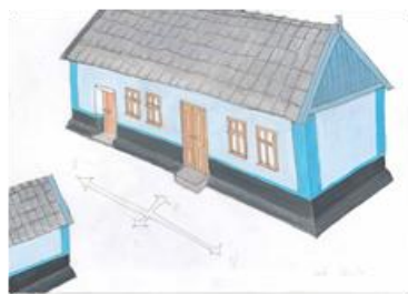
Рис. 2. Оформление и архитектура дома, украинское село, Молдова, Левобережье (1940-1970 гг.)

Орнаментальные мотивы на коврах, одежде, подушках и простынях в культурном наследии средней части Левобережья Днестра республики Молдова начала XX-го века изобилуют изображениями роз, маков, а также птиц, голубей, петухов, иногда курочек-несушек и т.д.