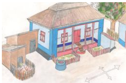
Рис. 1. Оформление и архитектура дома, молдавское село, Молдова, Левобережье (1930-1960 гг.)

Смысловая нагрузка белого цвета, как основного, остается неизменной и в народном костюме. Цвет в одежде, в основном в вышивке, аналогично интерьеру используется как акцент, украшение и оберег.