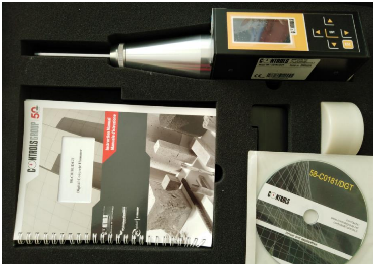
Fig. 2. Set sclerometru digital