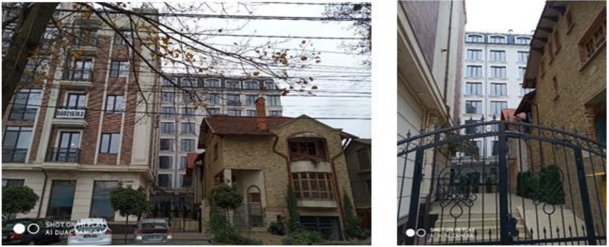
Рис. 3. Новые застройки в историческом квартале

В результате проведенных расчетов инсоляции (см. рис.4), было установлено, что здание построенное по ул.Болгарэ,5 затеняет юго-западный фасад здания по ул. Бернардацци, 25 – полностью, который инсолировался в течении 3 часов 30 минут изначально. Имея в виду, что северо-восточный фасад с жилыми комнатами не обеспечен инсоляцией в нормативный период в 2 часа 30 минут изначально (рассчитанный период составляет 1 час 20 минут)- данная ситуация в согласии с NCM B.01.05:2019 считается нарушением санитарных и строительных норм.