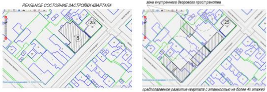
Рис. 7. Застройки квартала

Качество жилой среды рассматривается на разных уровнях: как для отдельного здания, так и для территории застройки в целом. Комплексность как метод реконструкции состоит в одновременном осуществлении мероприятий по планировочной организации территории, сносу малоценных и строительству новых жилых и общественных зданий, капитальному ремонту зданий и охраняемой застройки. Кроме этого, при реконструкции жилищного фонда в исторических районах крайне остро стоит вопрос о сохранении и преобразовании застройки, ценной в градостроительном, историко-культурном, архитектурном и художественном отношении. Исходя из вышесказанного, сохранение кварталов в прежних размерах, при правильном выборе архитектурного стиля, формы - не превышая объемно-пространственных пределов, создаст возможность восприятия данной территории в контексте его исторических характеристик. При невозможности восстановления исторического облика зданий в связи с их утратой во времени, предложенный подход предполагает на некоторых участках центральной исторической зоны сохранить психологическое восприятие квартала, как части прошлого при возможном рациональном увеличении плотности застройки. ( см. рис.7)