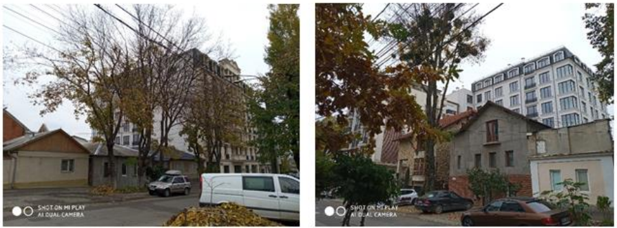
Рис. 2. Новые застройки на пересечении улиц Болгарэ, 5 с ул. Бернардацци, 25

На начальном этапе строительства первым было построено здание по ул. Бернардацци, 25 с режимом высот в П+4Е. В результате расчетов было доказано, что санитарные нормы в области освещенности и инсоляции были соблюдены. Эти данные подтвердились и при натурных исследованиях.