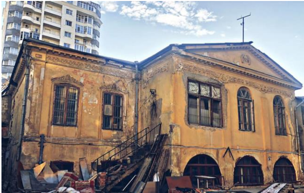
Рис. 1. Городской особняк семьи Казимир-Чешко, ул. Сергея Лазо, 24

их сноса, точно застраивают данную территорию зачастую пренебрегая санитарными и строительными нормами.