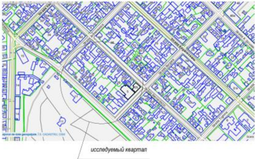
Рис. 6. Ситуационный план

Качество жилой среды рассматривается на разных уровнях: как для отдельного здания, так и для территории застройки в целом. Комплексность как метод реконструкции состоит в одновременном осуществлении мероприятий по планировочной организации территории, сносу малоценных и строительству новых жилых и общественных зданий, капитальному ремонту зданий и охраняемой застройки. Кроме этого, при реконструкции жилищного фонда в исторических районах крайне остро стоит вопрос о сохранении и преобразовании застройки, ценной в градостроительном, историко-культурном, архитектурном и художественном отношении. Пренебрежительное отношение к архитектурно-градостроительному наследию, отсутствие четкой политики в этой сфере часто сводит на нет все усилия по сохранению исторической городской среды. В результате мы получаем целый градостроительный комплекс проблем для центральных районов города, доведенных до определенной степени деградации и даже аварийного состояния.