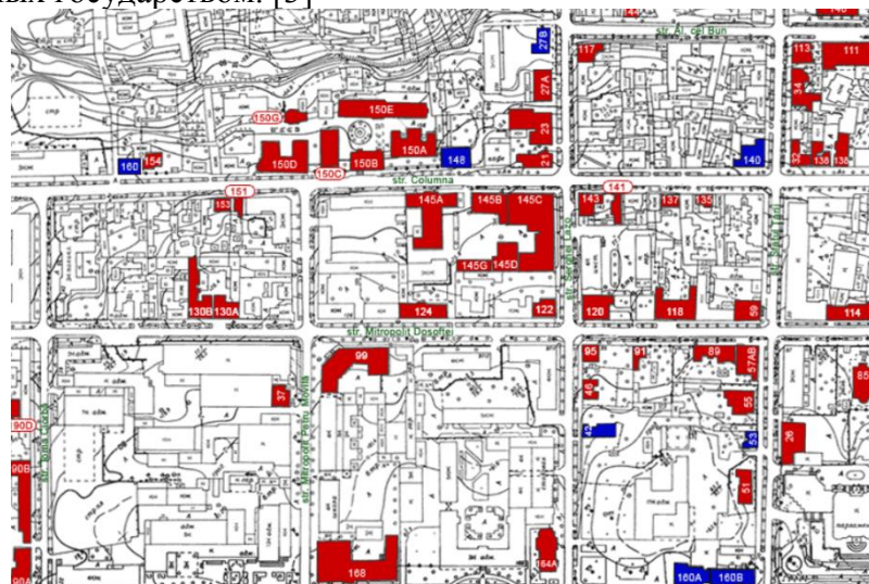
Рис. 1. Фрагмент топографической карты с выделением исторических зданий архитектурной ценности мун. Кишинёва. [4]

На основании Постановления Правительства № 633 от 8 июня 2004 г. Об утверждении Плана действий по обеспечению соблюдения положений Закона № 835-ХІІІ от 17 мая 1996 года о принципах урбанизма и территориального планирования и других соответствующих законодательно-нормативных актах было принято решение о предоставлении статуса охраняемой территории национального значения: историческому центру Кишинева, расположенному по периметру улиц А.Матеевич – Альбишоара, Измаил – Михай Витеазул и построенный исторический фонд, позиции 308 и 283 Реестра памятников Республики Молдова, охраняемых государством. [3]