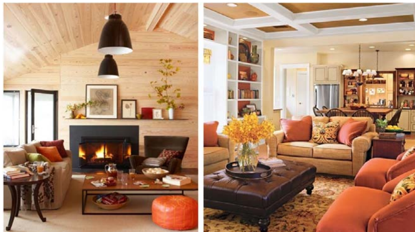
Рисунок 5 – Осенний аромат через формы и цвета в дизайне интерьера

Прекрасная осенняя история, перенесенная в дизайн интерьера, создавая гармоничную композицию с элементами внутри, приводит к широкому знанию цветовых эффектов, вдохновленных палитрой сезона, цветов в их взаимосвязи с психологией человека, а также благодаря захватывающим и художественным сочетаниям, цвета, вдохновленные природой (рис. 6).