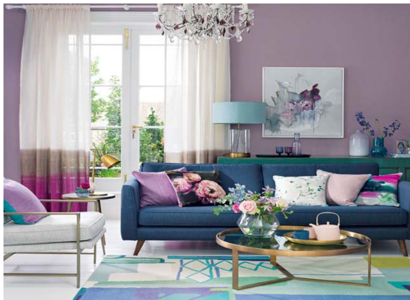
Рисунок 2 – Зимний сезон в дизайне интерьера гостиной

верхности, холодные узловатые цветовые акценты, контрастирующие с ароматом свечей и праздничных композиций: колокольчиков, шишек и цветных шаров [2; 6]. Стиль интерьера, созданный в зимних тонах, привносит аромат зимних праздников, который собирает всю семью у камина в гостиной и у елки с разноцветными огнями, призывающими к гармонии (рис. 2).