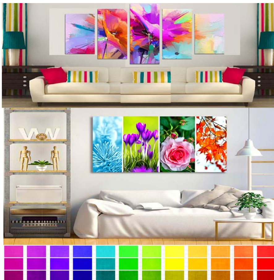
Рисунок 6 – Цветовые эффекты в дизайне интерьера