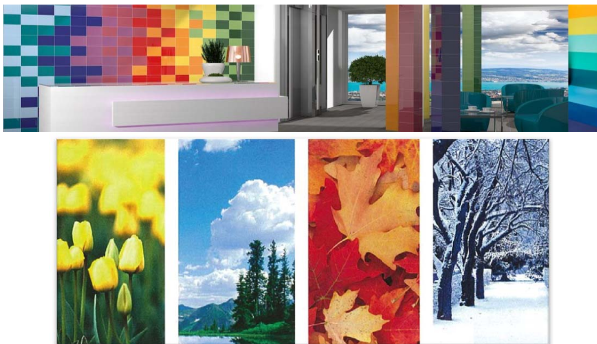
Рисунок 1 – Цвета времен года

Теоретические наблюдения и исследования творческих людей в этой области показали, что цвета и диапазоны цветовых оттенков времен года могут быть применены в дизайне интерьера. Из-за своего разнообразия природа часто является лучшим источником вдохновения для различных форм художественного выражения. Это также относится к «искусству», валентность которого простирается как в сфере эстетики, так и практики и функциональности, такой как дизайн интерьера. Природа дает нам все необходимое для изучения – «Теория времен года – Теория цветов в дизайне интерьера» или как выбрать цвета, подходящие для внутреннего пространства. Основная теория состоит в том, что в любое время года присутствуют все цвета, но со своим собственным отличительным оттенком и основным цветом [2; 5] (рис. 1).