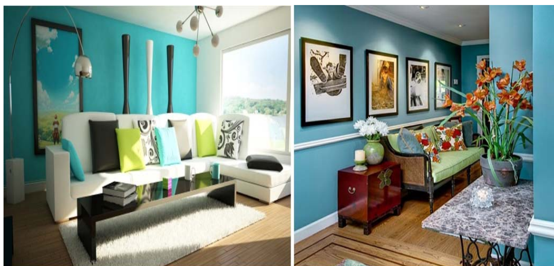
Рисунок 4 – Дизайн интерьера выполнен в стилистике летнего сезона

Основной цвет летнего сезона - зелено-голубой. Летом небо пропускает солнечные лучи через своего рода синий фильтр, и это, кажется, заставляет нас видеть все, как картины Леонардо да Винчи, через технику сфумато, сквозь туман, где фоновые плоскости имеют мягкие контуры. Палящее летнее солнце словно окутывает пеленой дыма все великолепие летних красок. Поэтому ощущение цвета в это время года серо-пастельное, приглушенное блеклыми зелено-синими красками (рис. 4), [3; 4].