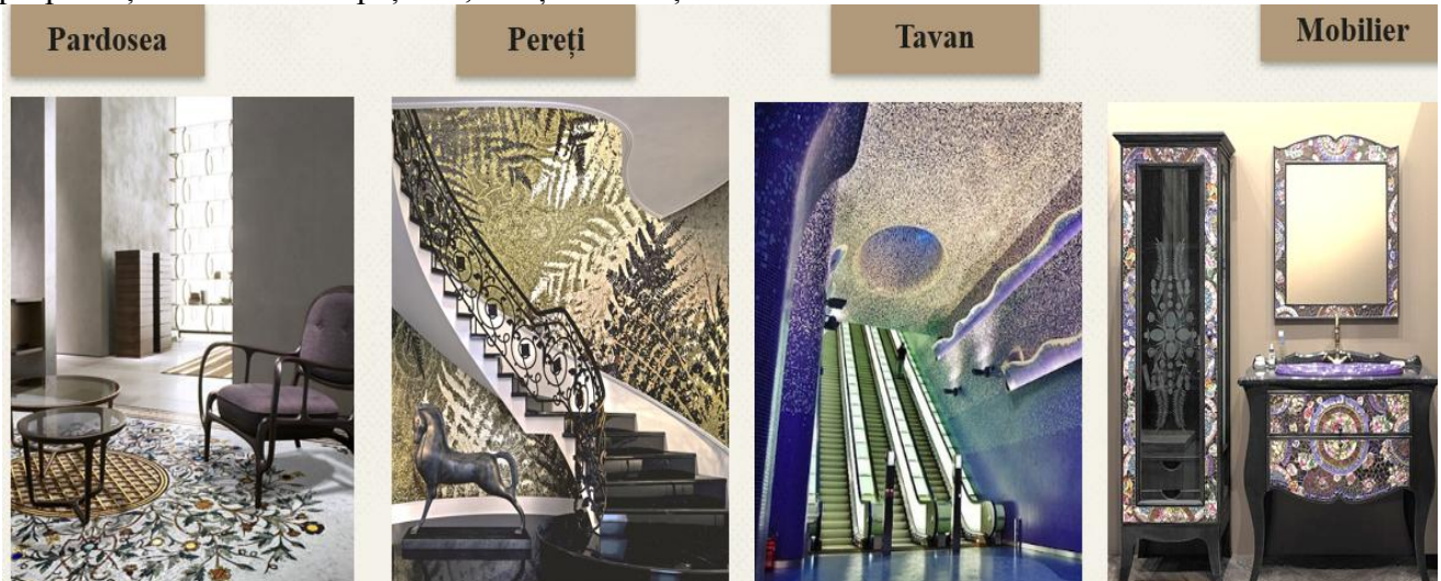
Figura 5. Zona de utilizare a mozaicului în design interior

Mozaicul poate fi clasificat după zona de aplicare: perete (mural), tavan, podea, mobilier (fig. 5); după metoda de așezare: directă, indirectă; după materialul utilizat: sticlă, ceramică, smalt, piatră, metal, plastic, lemn (fig. 6) etc, tipul materialului, metoda de aplicare depind nu numai proprietățile estetice ale spațiului, dar și de funcționale.