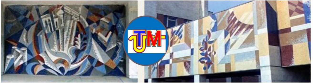
Blocul 9 al UTM, Mozaic parietal Autor: Alexandr Cuzimin