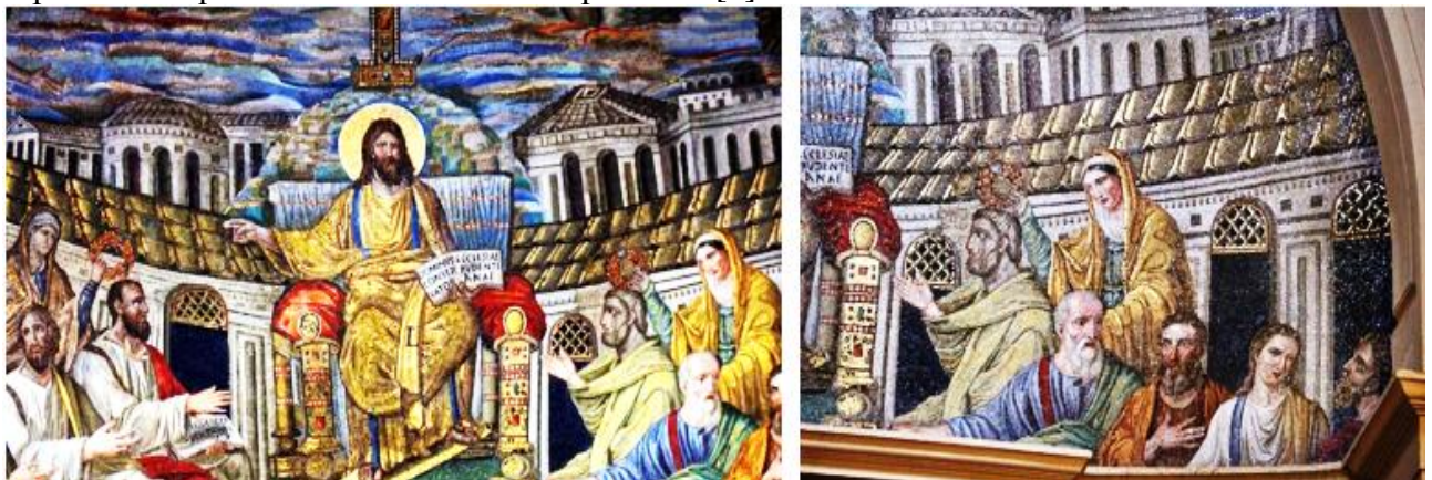
Figura 2. Mozaicurile din Santa Pudentiana din Roma

În Italia, s-au păstrat câteva lucrări monumentale, unele incluse în patrimoniul UNESCO: Domus Aurea - Roma (din anul 64 d. Hr., sub împăratul Nero), mozaicurile din Villa Romana del Casale din Sicilia (fig. 1) (începutul secolului al IV-lea, sub împăratul Maximian), Piața Victoria din Palermo. Din perioada timpurie a artei bizantine a cunoscut o evoluție strălucită în Italia. Pentru secolele al IV-lea Mozaicuri remarcabile ca frumusețe și grație, demonstrează continuitatea tradițiilor grecești din secolul al IV-lea (fig. 2), Mausoleului Santa Constanza din Roma, ce impresionează prin extraordinarele efecte picturale [1].