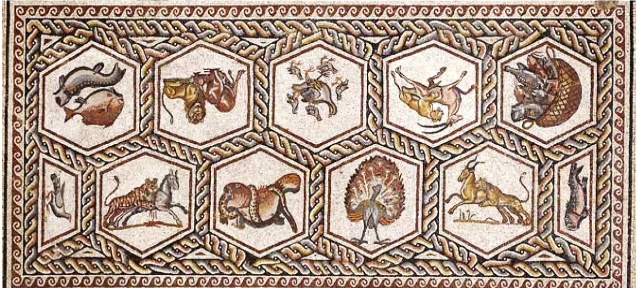
Figura 1. Mozaic pavimentar din Villa Romana del Casale, Sicilia

În parcursul său de la antichitate cu imperiile romane către prezent, mozaicul a fost dezvoltat în Imperiul Bizantin unde au fost prelungite tendințele lumii antice ale acestuia, conducându-l spre Evul Mediu și oferindu-i cea mai înaltă formă de rafinament. Odată cu sosirea creștinismului, mozaicurile au început să fie folosite pentru înfrumusețarea zidurilor și acoperirea bolților și cupolelor bisericilor. Zugrăvind tematica biblică, mozaicul avea drept scop instruirea credincioșilor. Luminile tremurătoare ale lumânărilor reflectate pe aurul mozaical și pe cuburile smălțuite de sticlă colorată creau o atmosferă mistică. Storia dell'arte italiana , de Giulio Carlo Argan , spune: „ Arta mozaicului era în armonie perfectă cu ideologia timpului , mult influențată de neoplatonism. În arta mozaicului are loc un proces prin care materia se spiritualizează, devine lumină și formă “ [1, 2, 3].