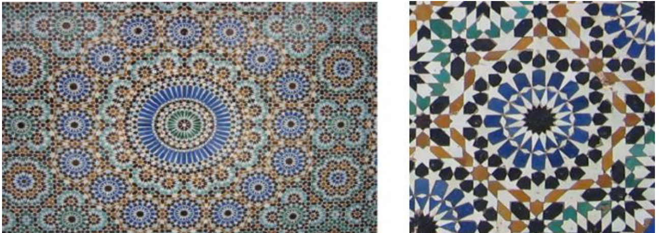
Figura 3. Geometria în arta mozaicului islamic

Explicația etimologică, din limba italiană, cuvântul "mozaic" este tradus ca "pliat din piese". Cele mai obișnuite materiale pentru crearea de pânze de mozaic sunt piatra naturală, smalt (fragmente colorate de sticlă), ceramica, lemn, metal etc. Mozaicurile au fost utilizate atât pentru a decora pereții caselor particulare, publice în interior, exterior, cât și pentru a decora pavaje, bazine și fântâni, mobilier etc., devenind un fel de măsură a bunăstării proprietarului. Mozaicul monocrom, un stil mozaical alb-negru, mozaicul cromatic a devenit predominant de-a lungul mai multor secole pentru decorul mural, pavimentar și de tavan, expus prin compoziții variate [4].