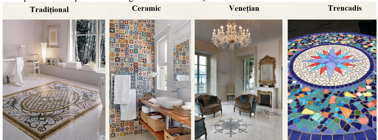
Figura 4. Clasificarea specificului mozaicului

• Mozaicuri tradiționale: mozaicuri romane: create din materiale dure, cum ar fi marmura, potrivite pentru pardoseli. Mozaicurile au fost realizate prin aplicarea unor fragmente minuscule (tessere) din marmură în diferite culori pentru a crea imagini cu o valoare decorativă deosebită. În timpul Art Nouveau, pe lângă marmură, s-a folosit argila ceramică care, datorită rezistenței sale, a făcut posibilă încorporarea în imagini a unei diversități de culori.